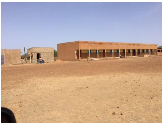
Het nieuw gebouwde Lyceum.