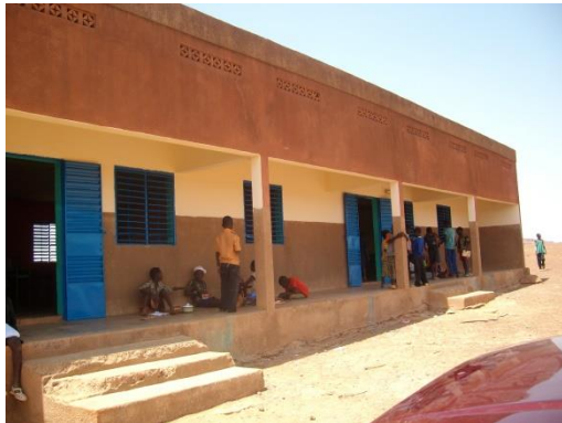
De gerenoveerde lagere school.